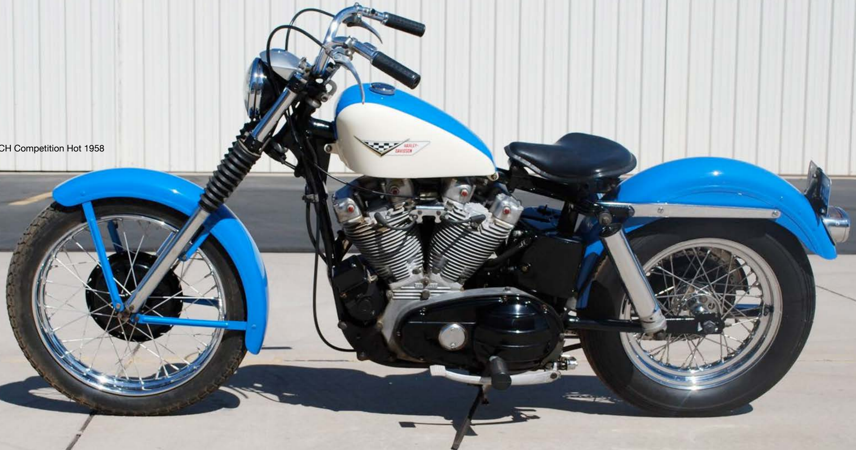
XLCH Competition Hot 1958

cuya constante evolución no solo le ha permitido mantenerse en activo durante 60 años, sino también seguir marcando tendencias seis décadas después de su nacimiento, que es algo de lo que ninguna otra marca puede presumir, ya que la Sportster es el modelo más longevo de la historia del motociclismo .